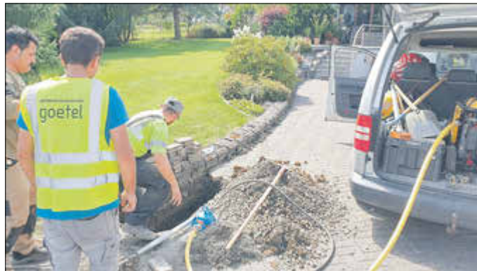
In Appenrod wird ein Hausanschluss gelegt

„Das ist schon toll, wie reibungslos diese lange ersehnte und ungemein wichtige Infrastrukturmaßnahme für ganz Homberg umgesetzt wird“ freut sich Bürgermeisterin Simke Ried und weist darauf hin, dass bisher unentschlossene während der Bauphase noch aufspringen und in den Genuss eines kostenfreien Hausanschlusses kommen können. „Sprechen Sie einfach die Arbeiter an, das ist der einfachste Weg“. Gleichzeit weist Sie nochmals auf die zentrale Koordinierungsstelle der Stadt Homberg hin. Peter Pfeil ist unter ppfeil@homberg.de oder 06633 184-41 für alle Fragen und Hinweise erreichbar und hält den kurzen Draht zu den Ausbaunternehmen. Nutzen Sie bei Bedarf diesen erfolgreich praktizierten Weg für Ihre zukunftsweisenden Anschluss ans Glasfasernetz.