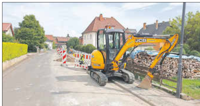
Leitungsverlegung im Beuneweg