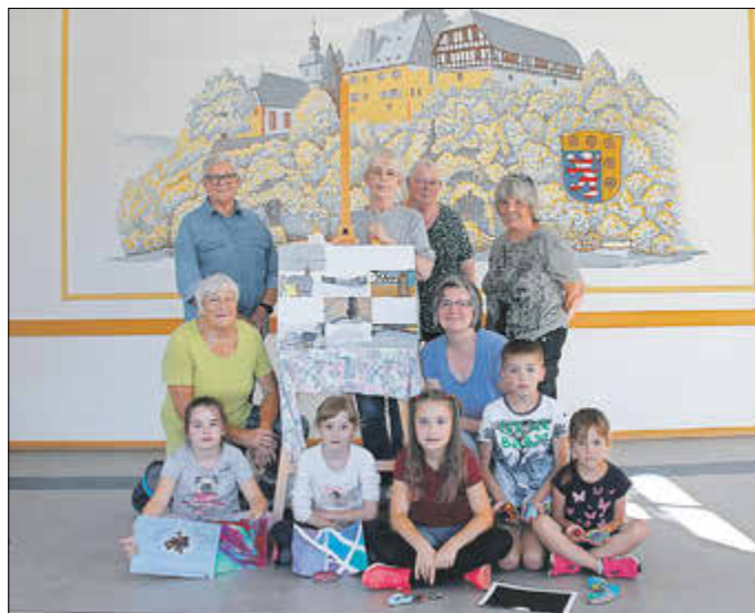
Stolze Präsentation der kleinen „Kunstwerke“, die im Rahmen der Ferienspielaktion „Kinder malen und erforschen ihre Heimat“ entstanden sind.

Unter dem Motto: „Kultur jederzeit“, initiiert das „TraVobil - Büro für kulturelle Einmischung“, gemeinsam mit den Menschen der Region des Vogelsbergkreises zeitgenössische Veranstaltungsformate, stärkt kulturelle Vielfalt und schafft neue Netzwerke. So wurde die „Fördergemeinschaft 750 Jahre Burg-Gemünden e.V.“, für ihre finanziellen Aufwendungen, sei bei Vorträgen und vielem mehr bis hin zur Unterstützung der Anschaffungskosten für die Malprojekte, inzwischen dankenswerter Weise von „TraVogelsberg“ mit 1000 Euro unterstützt.